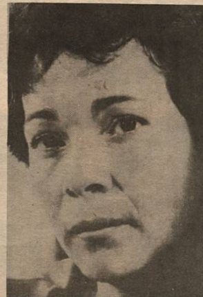
Nora Astorga: calificó de falaz el discurso de Arias.

bertad, donde nadie es objeto de opresión ni marcha al destierro. Puntualizó sin embargo, que es un país enfrentado a grandes problemas, que van desde la pobreza hasta las amenazas a la paz. Dijo que llegaba a la ONU con el mensaje alegre de una nación que ve como única esperanza de paz para las Américas, la democracia y la justicia.