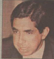
Presidente Oscar Arias

El Jefe de Estado aseveró, ante la cuadragésimo primera Asamblea General de las Naciones Unidas, que los sandinistas traicionaron las ansias democráticas de los nicaragüenses y los acusó, además, de ser la fuente de la inestabilidad en Centroamérica. El Dr. Oscar Arias Sánchez aseveró que los comandantes sandinistas no quieren escuchar el mensaje de libertad de la historia, así como tampoco quieren estrechar la mano franca de Contadora y se encierran en un dogmatismo estéril tratando de consolidar un estado militar y totalitario. Al referirse a la acusación planteada por Nicaragua contra Costa Rica ante la Corte Internacional de Justicia de La Haya, el mandatario declaró que "queremos que, en La Haya, el mundo entero vea la verdad oculta de una Nicaragua donde Sandino fue traicionado una vez más. Hace siete años Sandino resucitó para celebrar la libertad de un pueblo. Una vez más lo han asesinado". Enfatizó que el despertar democrático en Centroamé-