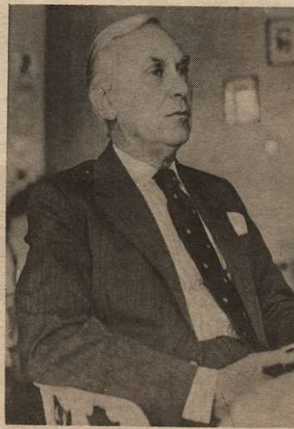
Lic. Rodrigo Madrigal Nieto: anunciará hoy el restablecimiento de relaciones con Marruecos.