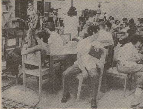
Los periodistas esperaron durante largas horas para conocer los resultados. Una lucha por obtener de primeros las informaciones de las que está pendiente el mundo entero.

El vocero se mostró un poco más sombrío que en sus presencias anteriores ante la prensa y al ser requerido acerca de las observaciones de la Resistencia en relación con la propuesta que presentó el general Humberto Ortega, jefe de la delegación sandinista como "síntesis de los puntos coincidentes de ambas partes", señaló que el nuevo planteo sandinista "repitió en mucho los conceptos